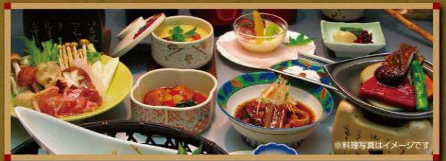
※料理写真はイメージです

関越自動車道・渋川伊香保ICから約20分。伊香保温泉地までは、約5分でお宿へ 四季のうつろいを楽しめる27ホールのチャンピオンコース 伊香保ゴルフ倶楽部